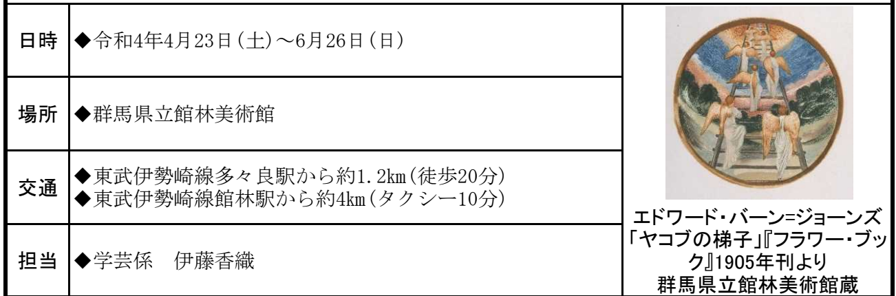
エドワード・バーン=ジョーンズ 「ヤコブの梯子」『フラワー・ブック』1905年刊より 群馬県立館林美術館蔵